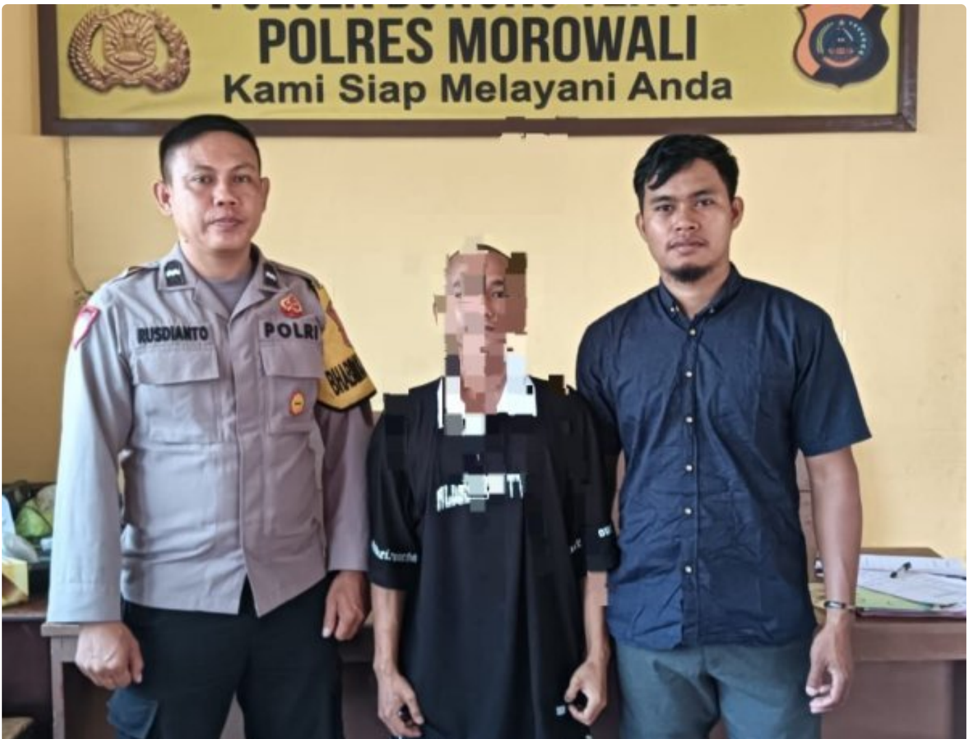
Aparat Polsek Bungku Tengah Berhasil Tangkap Pelaku Curanmor

MOROWALI, Sulawesi Tengah- Pada Hari Sabtu 5 Oktober 2024 Sekitar Pukul 18.30 Wita Kepolisian Sektor (Polsek) Bungku Tengah Polres Morowali, berhasil