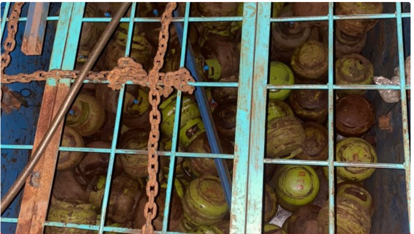
Tabung LPG 3 Kg bersubsidi yang amankan jajaran Polres Morowali

MOROWALI, Sulawesi Tengah- Jajaran Polres Morowali, Polda Sulteng baru-baru ini berhasil mengungkap kasus tindak pidana penyalahgunaan LPG 3Kg bersubsidi.